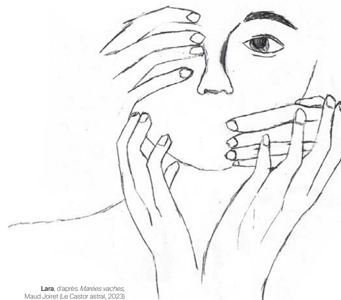
Lara, d'après Marées vaches , Maud Joiret (Le Castor astral, 2023)