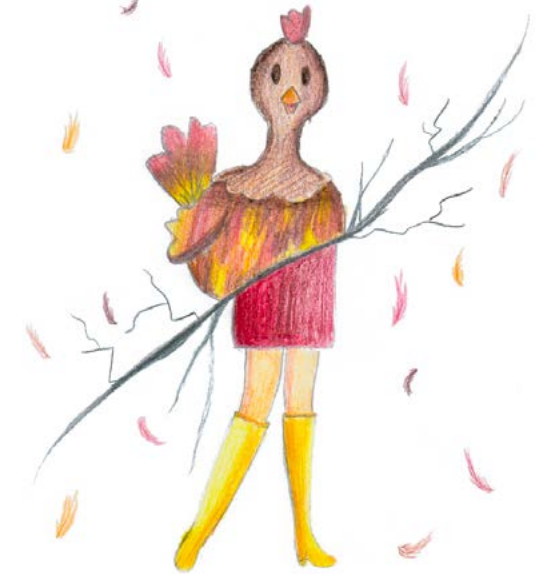
Candice & Anaïs, d'après Le Peigne-cocotte , Frédéric Léal (L'Attente, 2020)