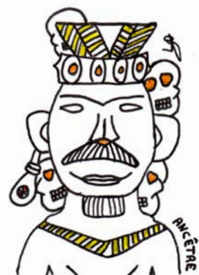
Laly, d'après Ancéfres , Ancestors, Laurence Vielle (MaelstrOm reEvolution, 2017)