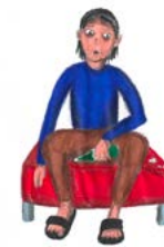
Siham, d'après Le Capital, c'est ta vie , Hugues Jallon (Verticales, 2023)